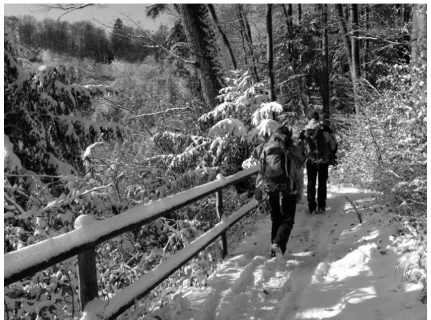
Auf tief verschneiten Wegen per pedes unterwegs ins Mösli